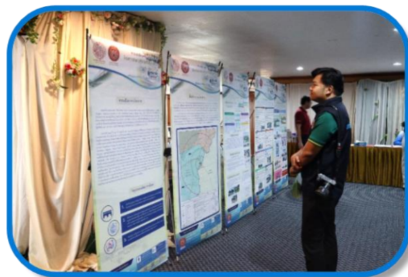
ผู้เข้าร่วมประชุมรับชมบอร์ดนิทรรศการ