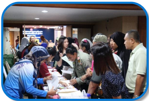
การลงทะเบียนและรับเอกสาร