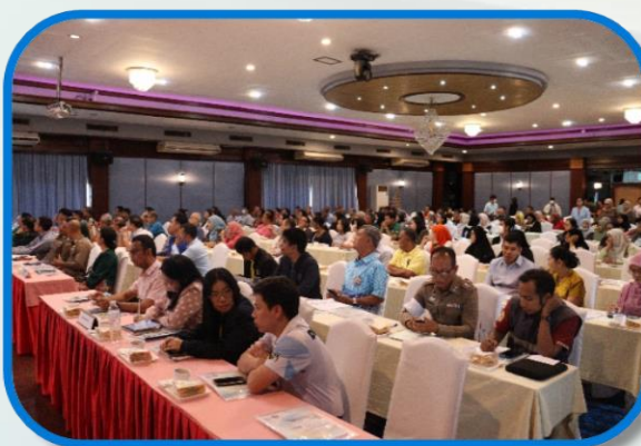
ผู้เข้าร่วมประชุมรับฟังการบรรยาย