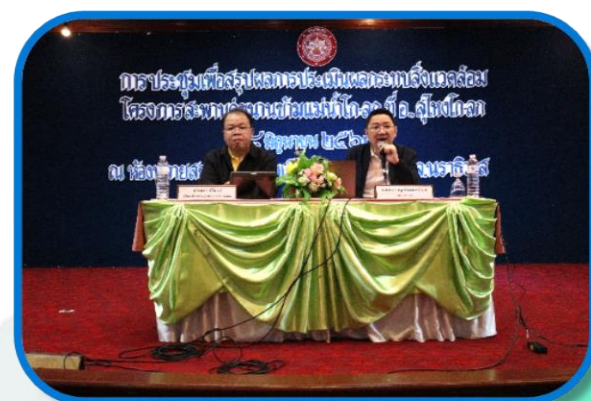
กลุ่มบริษัทที่ปรึกษา นำเสนอรายละเอียดโครงการ